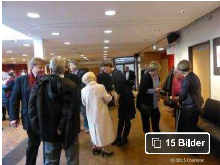
Neujahrsempfang im Haus im Park

Hamburg: Haus im Park | Zum Jahresbeginn hat es sich eingebürgert, dass in Bergedorf ein Neujahrsempfang stattfindet, ausgerichtet von Bürgerverein, Bezirksamtsleiter, Museumsdirektion, der Liedertafel , und dass alle Bergedorfer eingeladen sind. Dieses Jahr war der Spiegelsaal des Rathauses schon belegt durch die anstehenden Bürgerschaftswahlen und deshalb ins Haus im Park ausgewichen wurde.