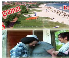
Reise ins Glück // Obdachloser zieht ins... von Max Bryan

Infos | Kontakt | Impressum | Datenschutz | Nutzungsbasierte Online-Werbung | AGB |