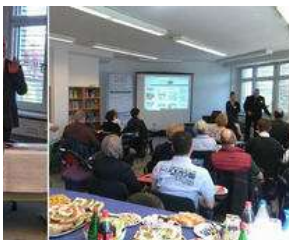
FreiwilligenBörseHamburg und Institut für Human- und... von Bernd P. Holst