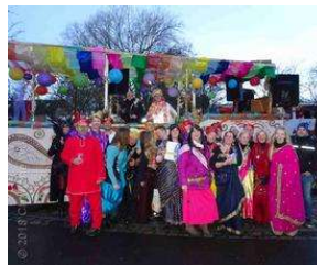
Bergedorferin freut sich königlich beim Marneval von Charlene Wolff